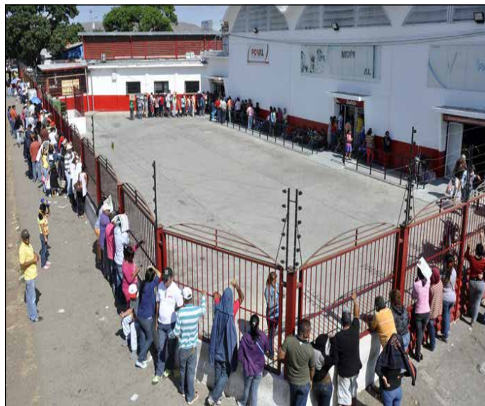
Filas para adquirir alimentos en Venezuela

La LTDA se planteó como objetivo garantizar la seguridad agroalimentaria, en ese sentido, uno de sus principios era garantizar que producción agraria se dedicara a partir de entonces a “atender de manera efectiva y eficiente la demanda alimenticia de la población” (Provea, 2002). No obstante, la producción agraria no solo creció significativamente en consideración a lo producido en el año 2000,