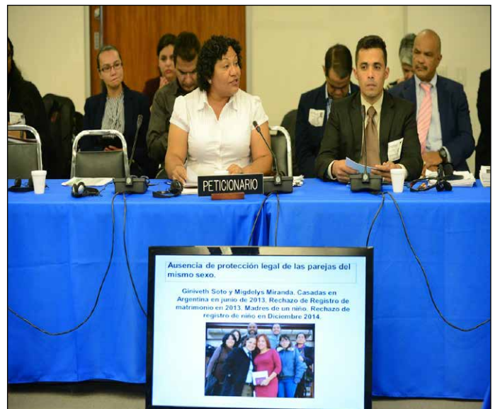
Audiencia sobre derechos LGBTI en Venezuela, marzo 2015

Una segunda línea de descalificaciones asegura que ambos organismos son "títeres del imperialismo", según, por "estar su-