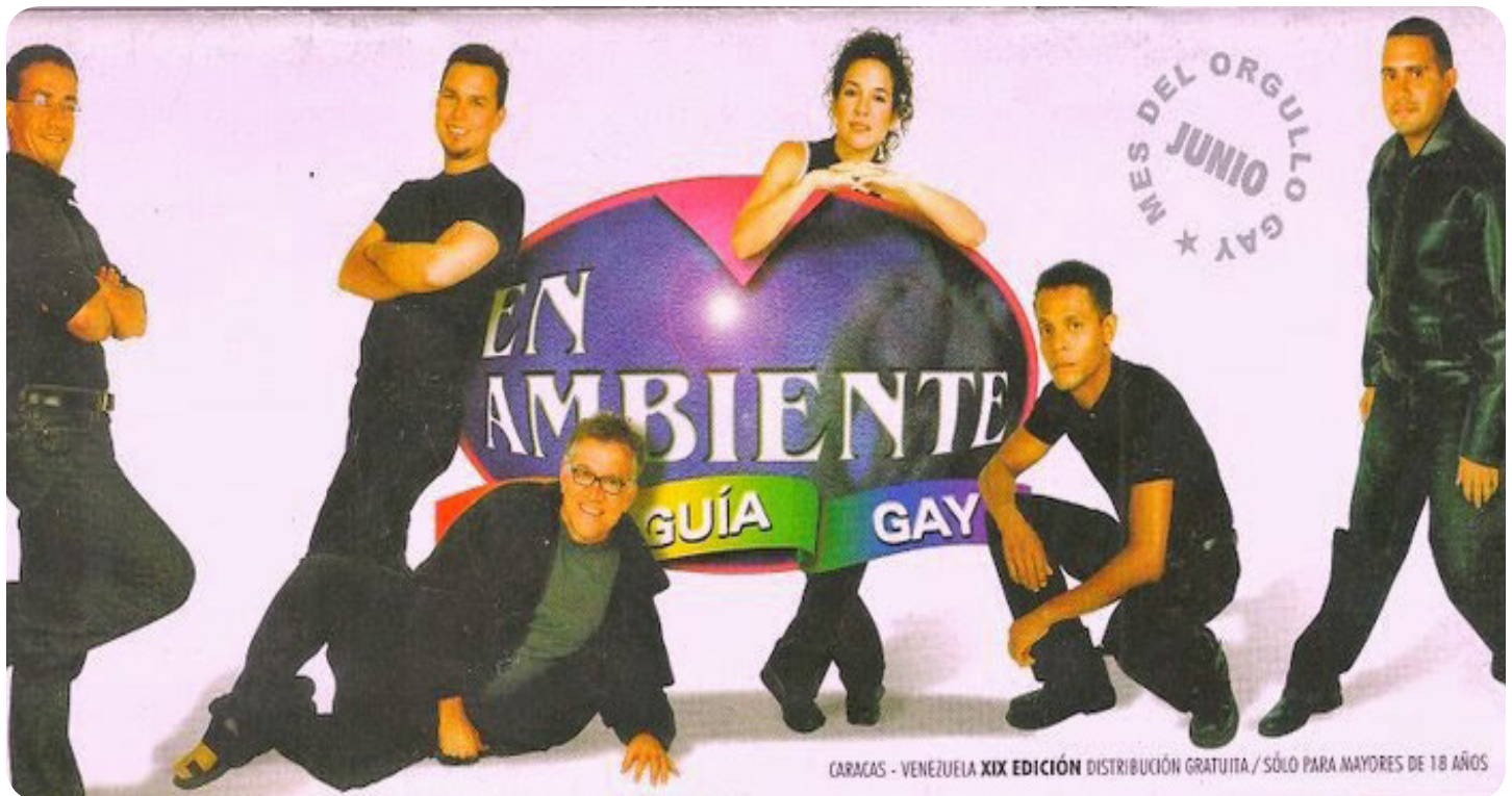
Publicidad para II Marcha del Orgullo Gay en Caracas, 2002.

riencia se diluyó por la falta de compromiso de miembros de las organizaciones para colaborar en la organización de los eventos. Razón por la cual, la preparación y organización de la marcha recayó, y/o fue asumida por la organización Lambda de Venezuela.