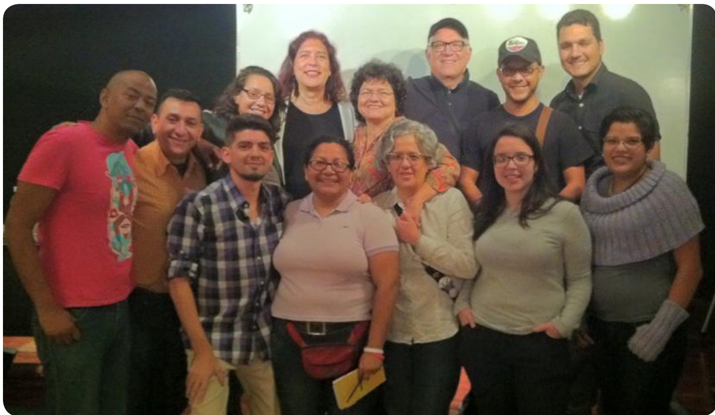
Reunión Red LGBTI Venezuela y activistas independientes con Diputada Tamara Adrián. 21 de diciembre, 2015. Caracas.

de adoptar una legislación amplia e integral de lucha contra la discriminación que la prohíba y prevea una definición que contenga una lista comprensiva de motivos de discriminación, incluyendo la orientación sexual y la identidad de género.”