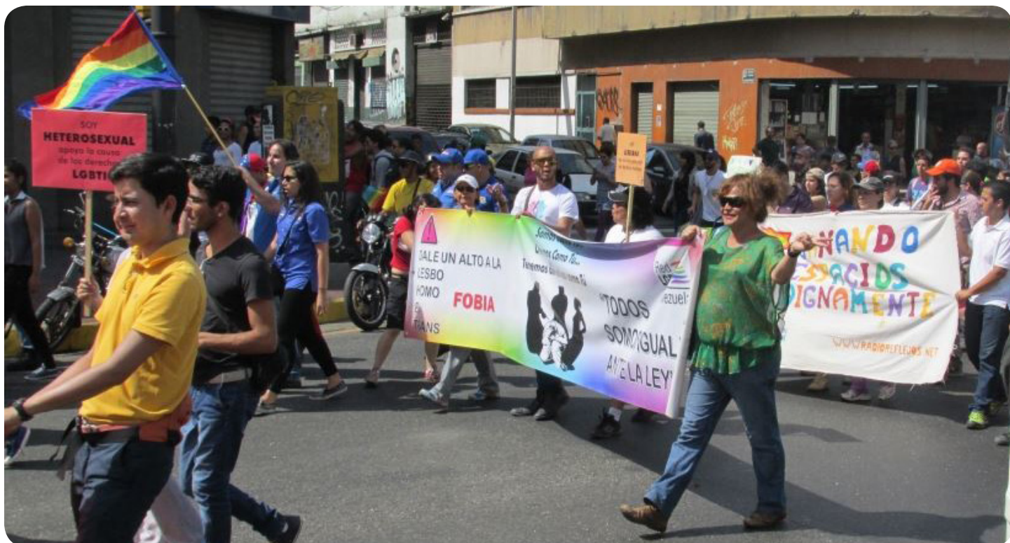
Cuarta Caminata por el Día Internacional contra la Homofobia en Caracas. Domingo 17 de mayo, 2015