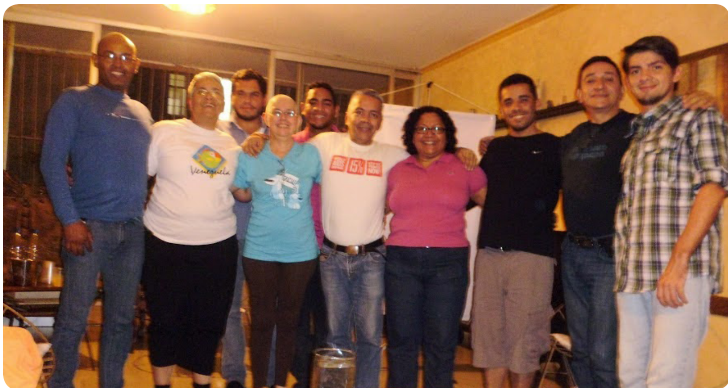
Reactivación Red LGBTI Venezuela. Aprobación nuevos estatutos y elección Junta Directiva. 22 de noviembre 2014. Caracas.