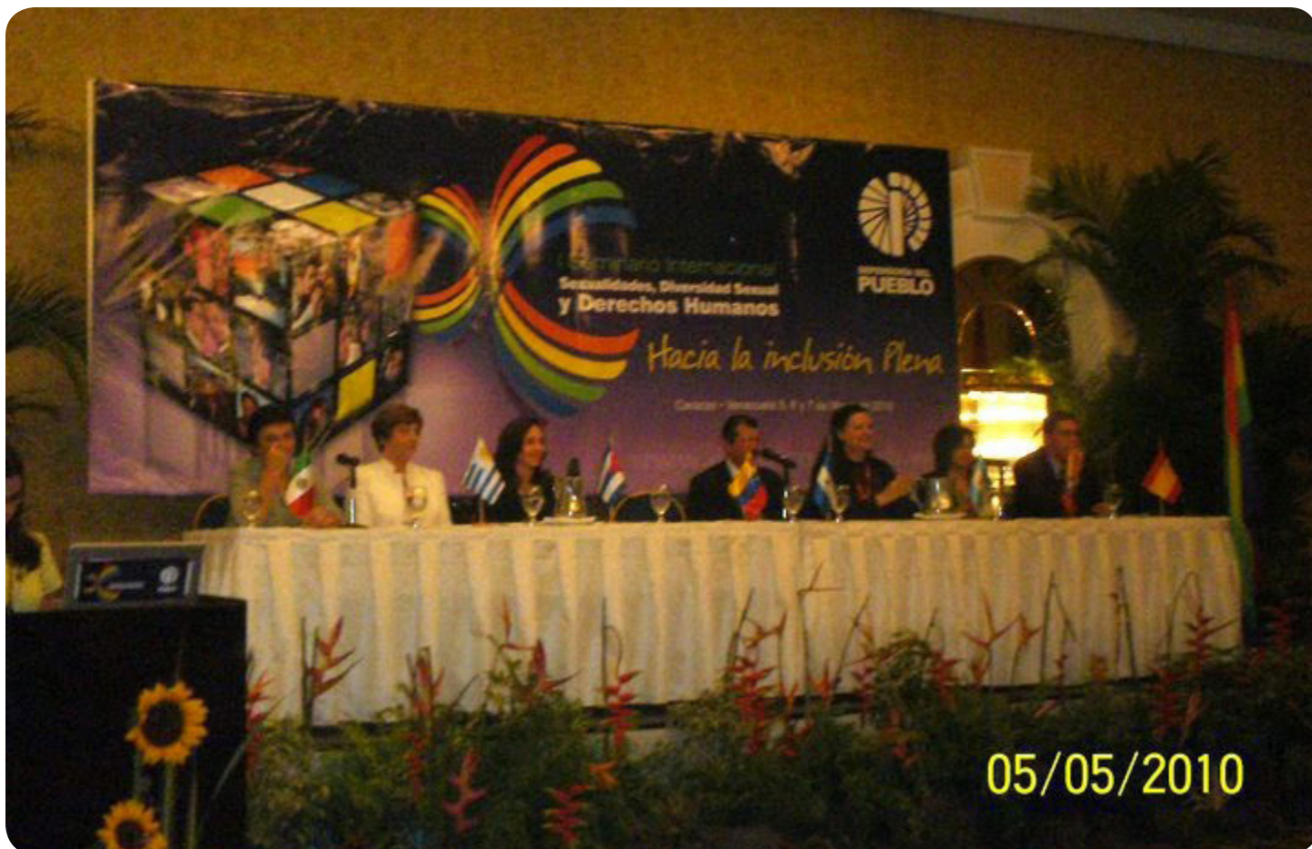
Seminario Sexodiversidad, Diversidad Sexual y DDHH Defensoría del Pueblo, 05 de mayo de 2010. Caracas.

manos de personas LGBTI en el continente americano, el 3 de noviembre de 2011, la CIDH decidió crear una comisión especial para las personas LGBTI, la cual se convertiría posteriormente en la Relatoría para los Derechos de personas LGBTI.