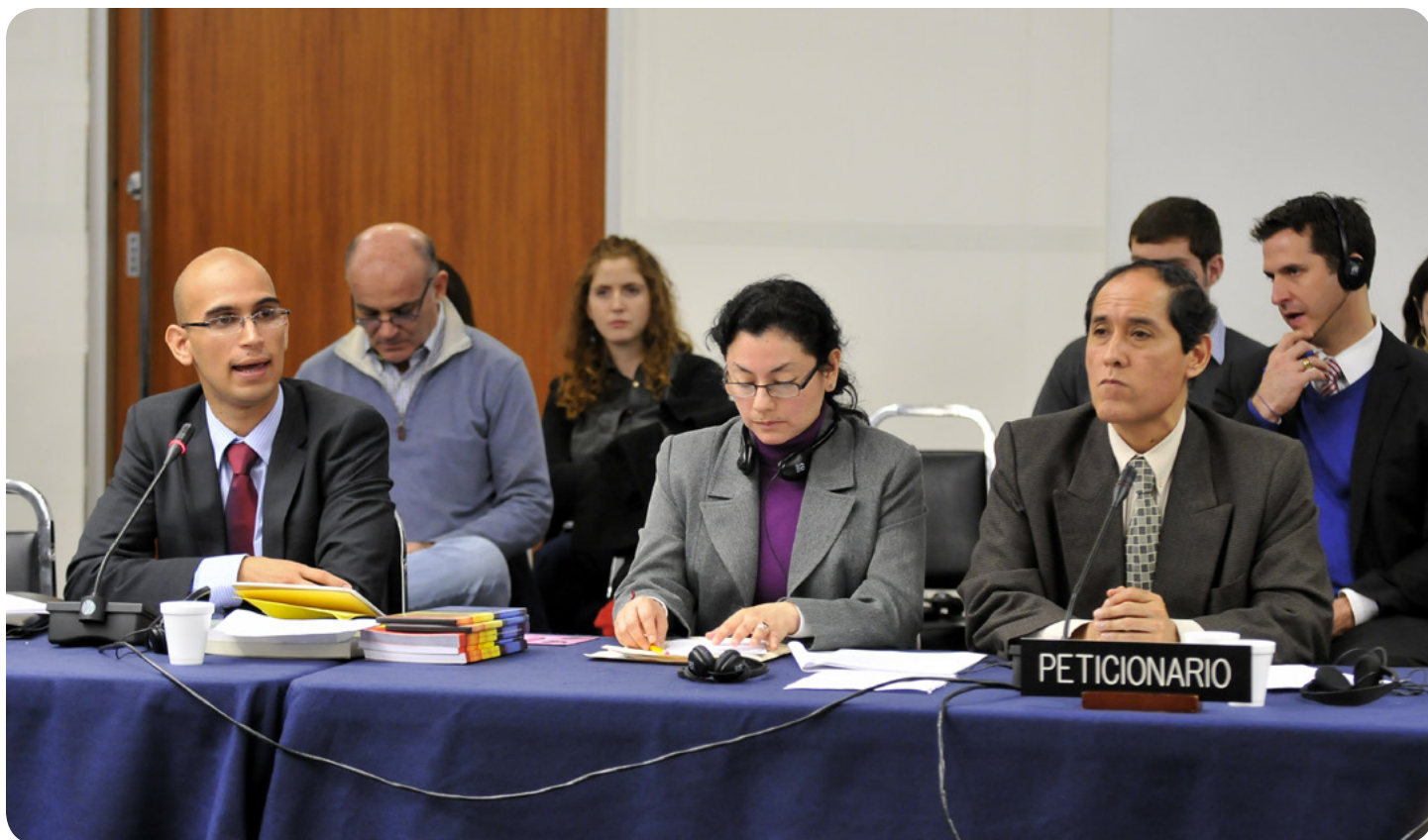
Presentación Informe sobre personas LGBTI en Venezuela ante la CIDH. 28 de octubre 2011, Washington, EEUU.