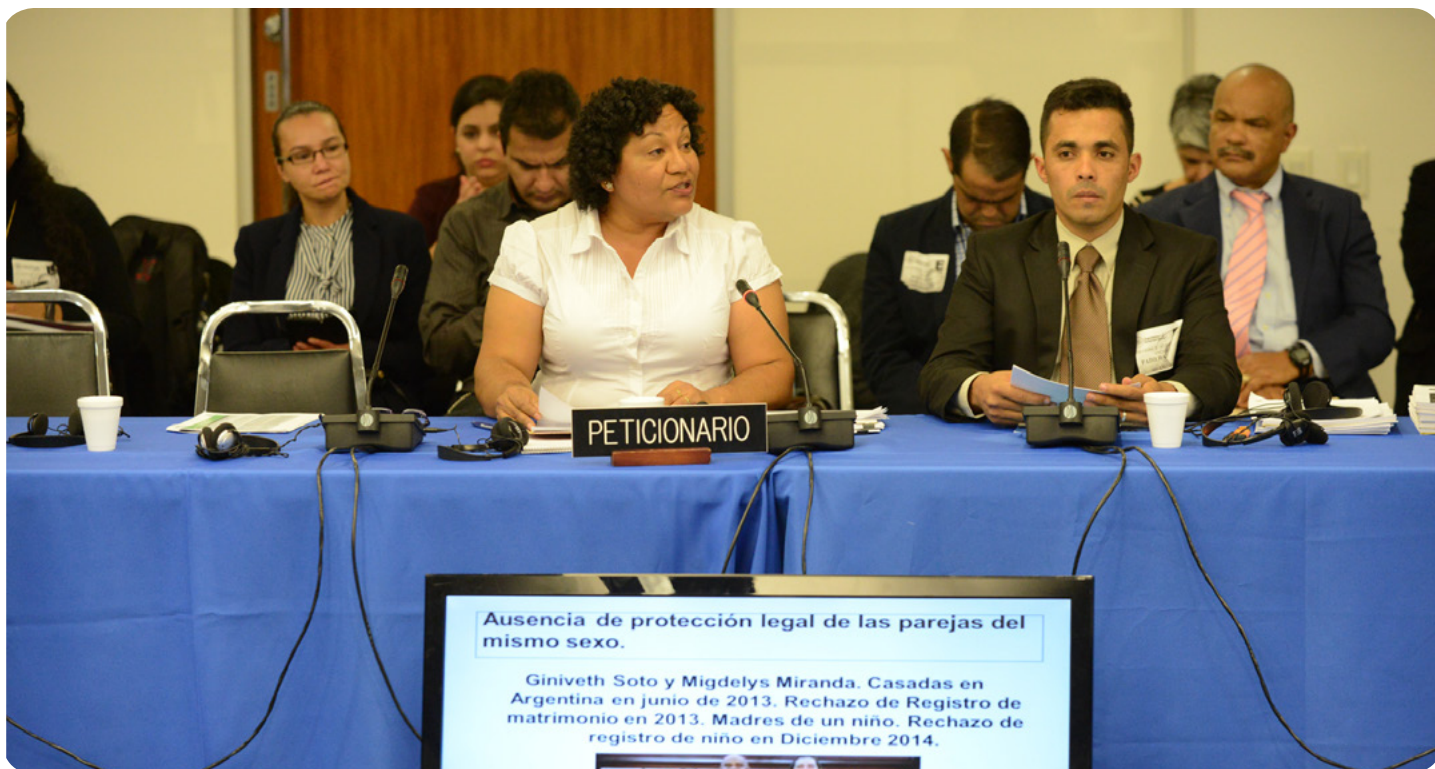
Presentación Informe Situación Derechos personas LGBTI en Venezuela ante CIDH. 17 de marzo de 2015 en Washington, EEUU.