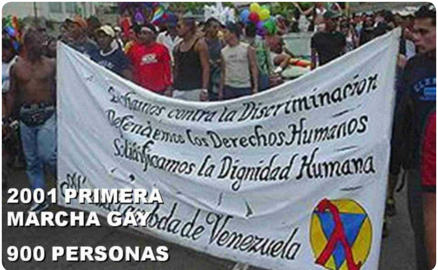
Primera marcha del Orgullo Gay. 2001. Caracas

las formas de expresión de la sexualidad humana, sin discriminación por sexo, género u orientación sexual.